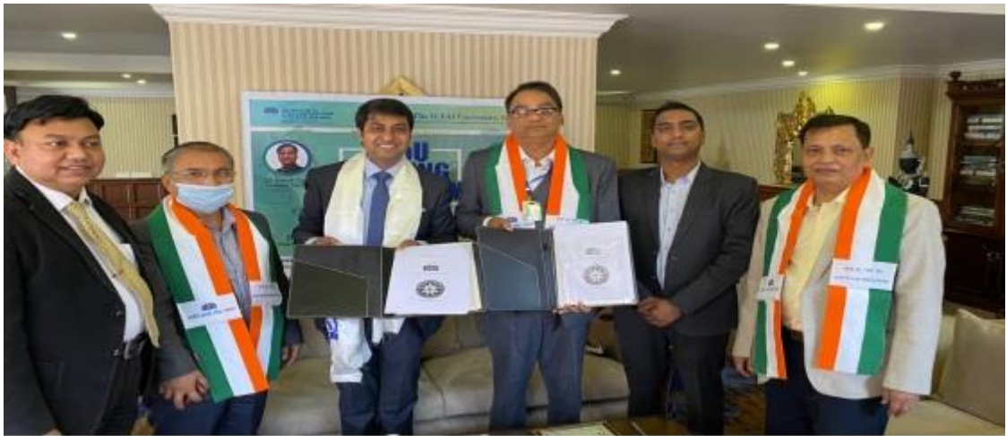
ICSI & ICFAI Sikkim