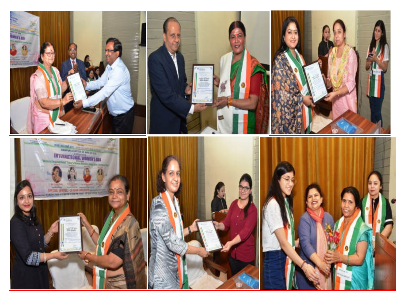
The large number of female Company Secretaries were presented on this occasion.